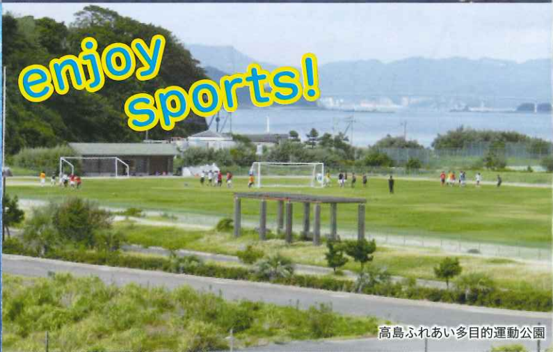
高島ふれあい多目的運動公園