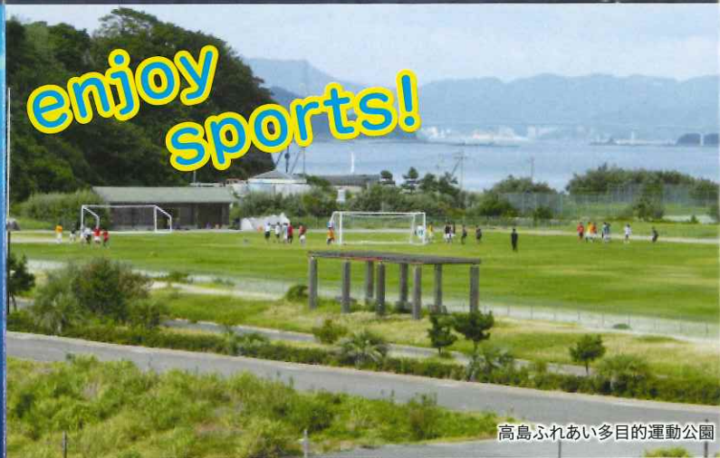
高島ふれあい多目的運動公園