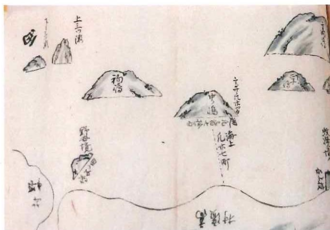
明治6年 高浜村中ノ島周辺絵図