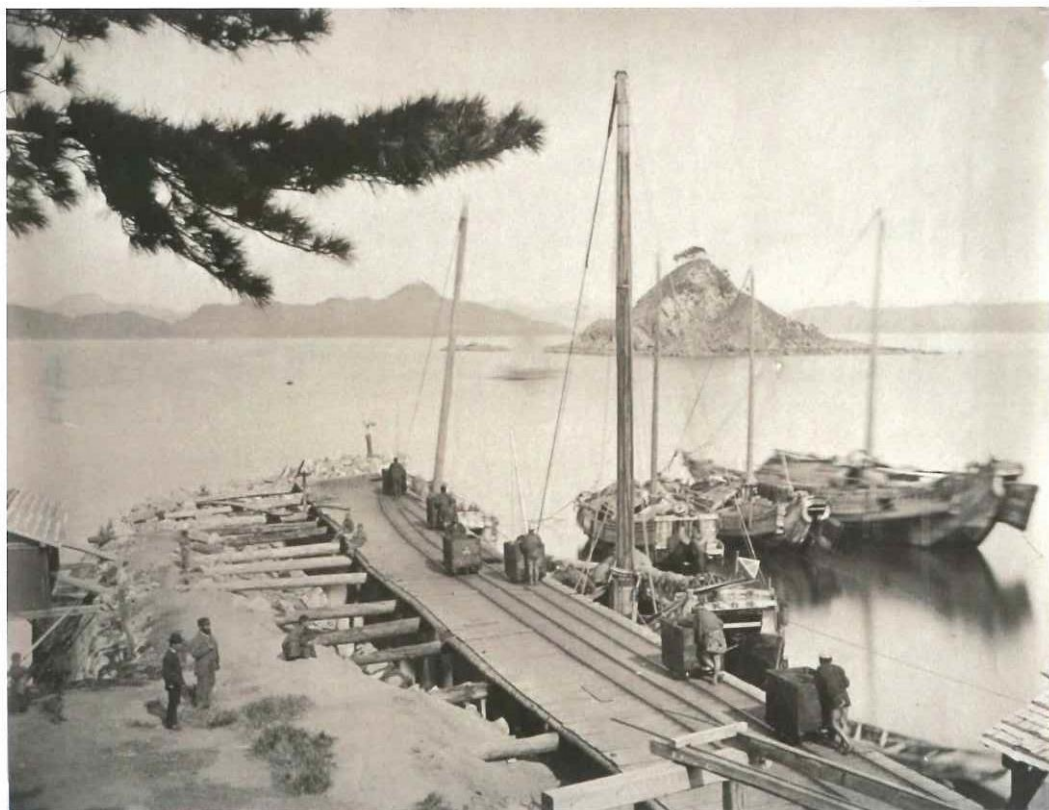
明治初期 高島炭鉱石炭船積場